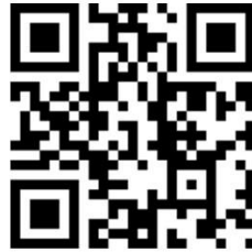
▲通報修繕進度查詢