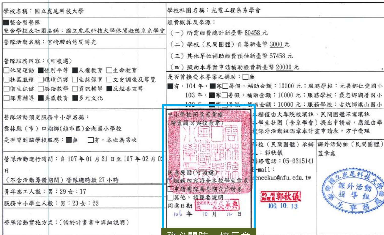
107年辦理「教育優先區中小學生■寒假□暑假營隊活動」申請經費補助計畫表