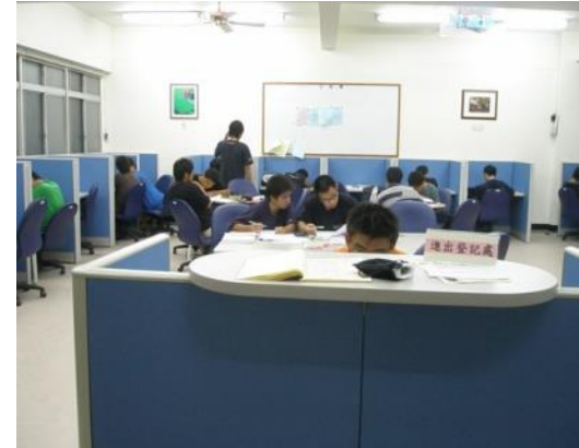
三舍學習資源中心