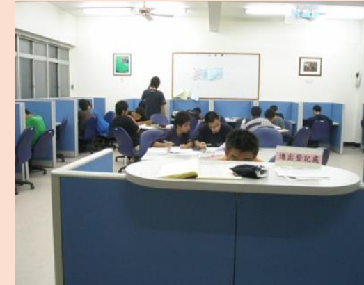
三舍學習資源中心