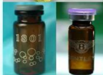
Mephedrone（喵喵）、 bk-MDMA、MDPV（浴鹽） 等安非他命類毒品