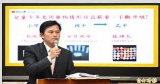
立法委員黃國昌針對校園毒品氾濫質詢教育部官員，指出台灣未成年者首次用藥的平均年齡竟是12.5歲，更有高達二成三比例是在校園吸毒，認為校園用藥氾濫，要教育部正視。

〔記者吳柏軒／台北報導〕校園毒氾濫！監察院審計部報告，一○三年度濫用毒品學生達七六一人，立法委員黃國昌更舉國家衛生研究院調查，台灣未成年者首次用藥年齡平均竟是十二・五歲，且高達二成三在校園吸毒，呼籲教育部正視。