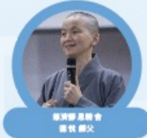
臺灣學 臺灣會 總統 鄭文 慶