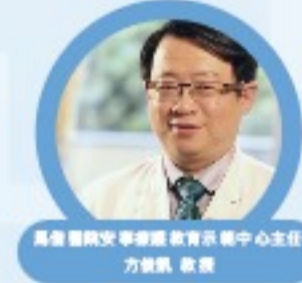
高雄醫學院 醫學教育研究中心主任 方景凱 教授