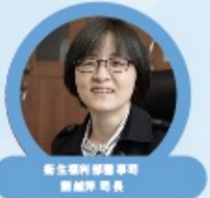
衛生福利部 醫策會 委員